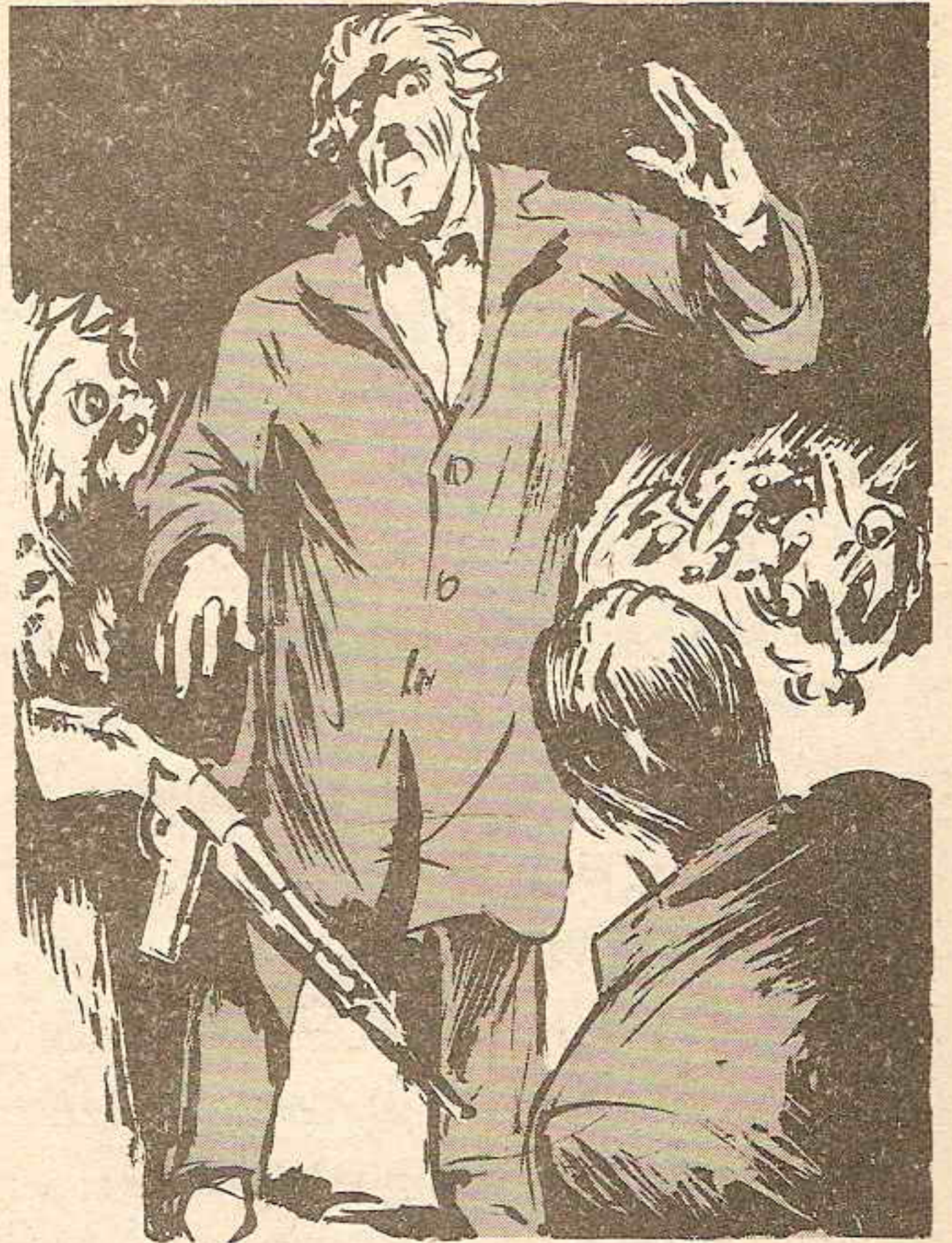
وقبل أن يستوعب الدكتور ( رمزى ) المفاجأة ، كان المدفع قد سقط من بين يديه ، ليستقر تحت قدميه ..

واستند المقدم ( ممدوح ) إلى أكتاف الرائد