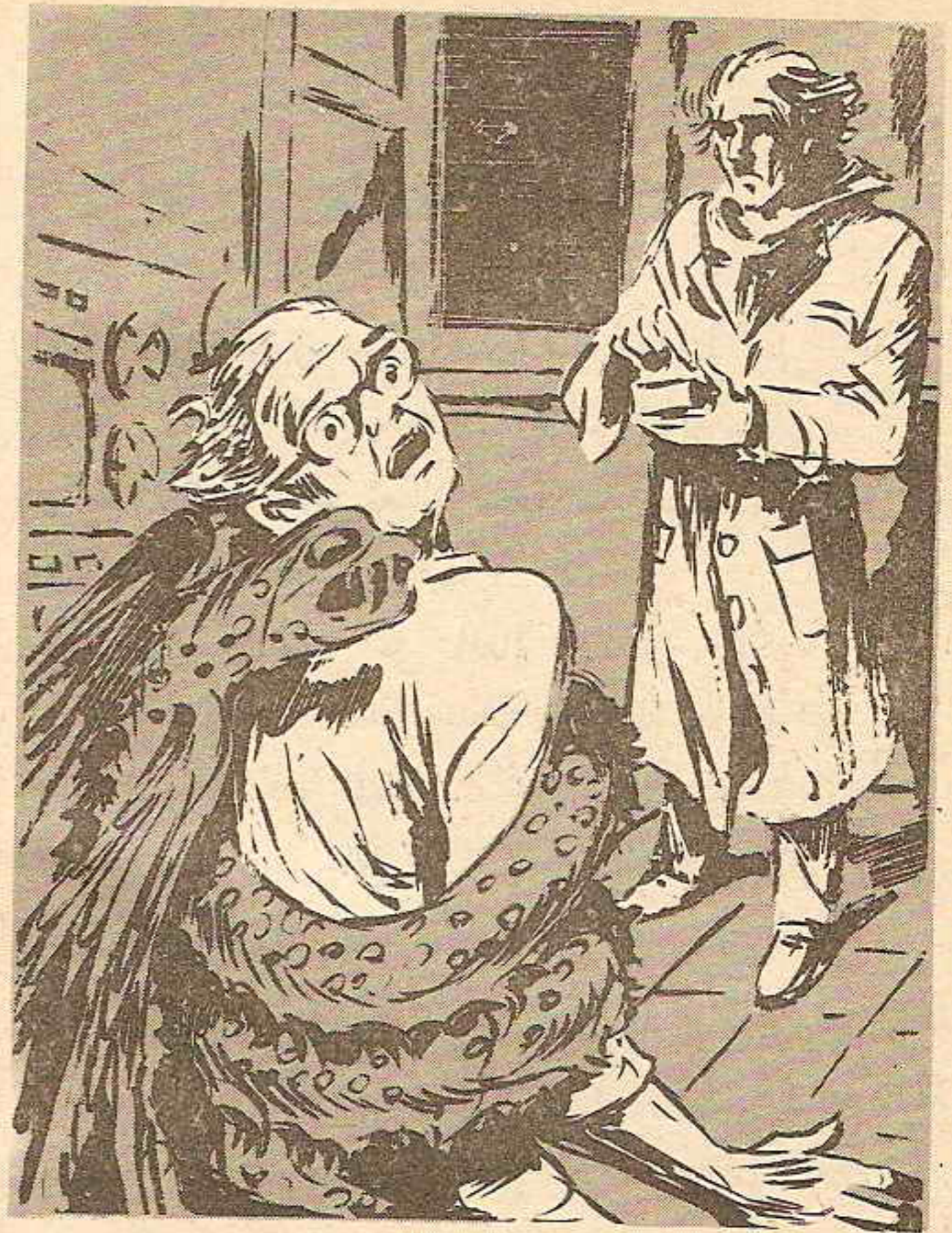
وبرزت أنيابه الرهيبة ، التي غرسها في عنق العالم المصري ، الذي اهتز بعنف ..

وأسرعت القطعة نحو أقدام الدكتور (مذكور) تتمسح بها ، وهي تموء .